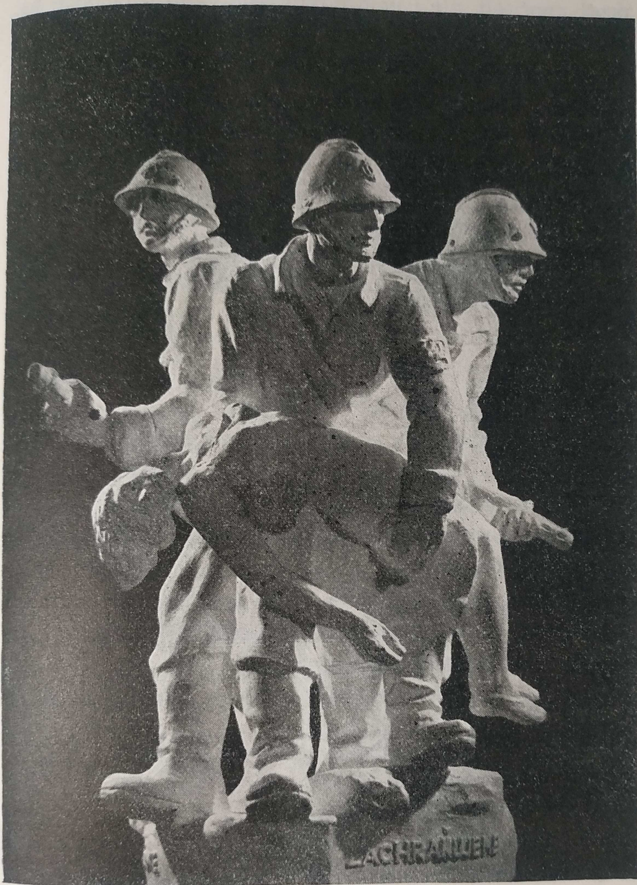
Horejcovo sousoší „Hasičstvo v odboji“.